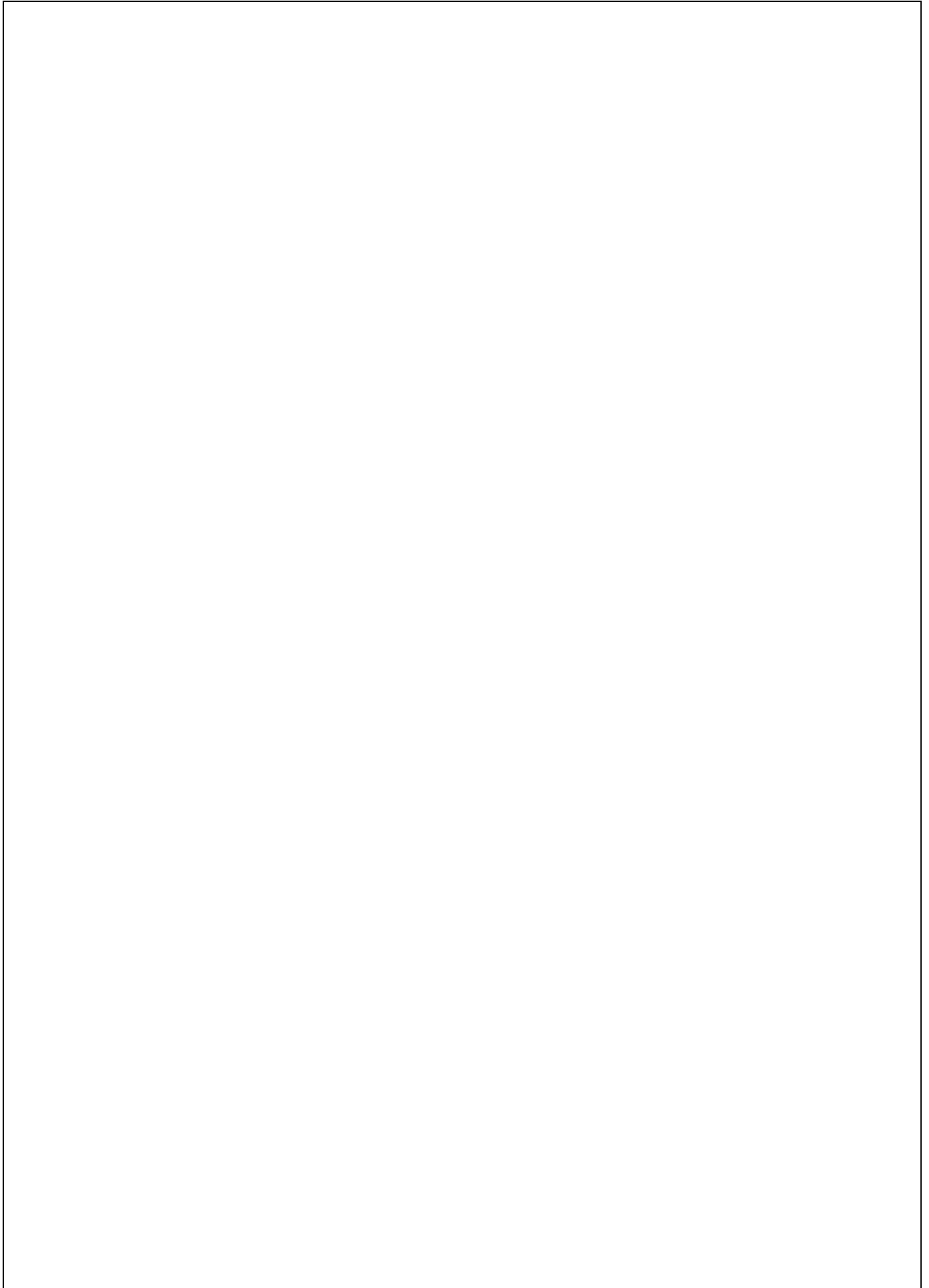
表27.資材採購單據黏貼處